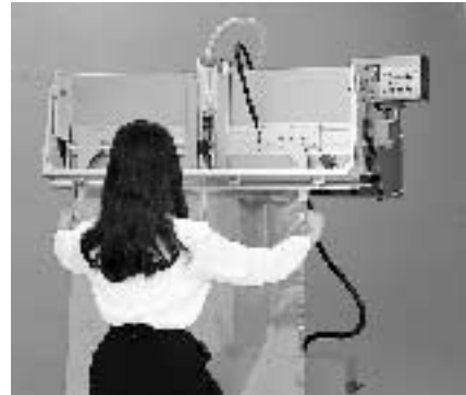
テンションアーム使用例

FIL-1000NTW (イジェクター脱気仕様機) は、圧縮空気を利用した吸引装置で、水分、油、粉末類などをノズルから吸い込んでも直接機械外部に放出させますので、装置に悪影響無くご使用いただけます。イジェクター式タイプは、脱気速度は真空ポンプ脱気式タイプ (NT) の2～3倍速いですが、到達真空度は真空ポンプ式タイプより劣ります。(下記仕様をご覧ください)