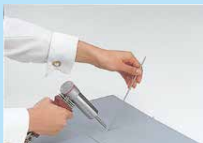
FL ガン(標準装備品)使用例