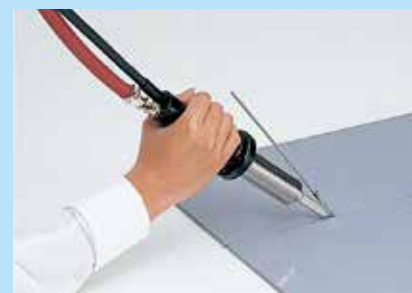
RL ガン(別売品)使用例